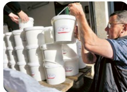
Réception des yaourts fermiers de Morey et des fruits et légumes cultivés à Marbache.

approvisionnements se font en circuit court. D'ailleurs, en ce mardi matin, c'est jour de livraison des yaourts fermiers de la fromagerie du Buzon à Morey. Chaque semaine, 46 pots de 5 kg sont déposés à la cuisine centrale, puis distribués et reconditionnés en petits pots en verre dans les différents sites de restauration. C'est aussi le jour d'arrivée des produits de maraîchage du chantier d'insertion du Bassin de Pompey. Cultivés à Marbache, fruits, légumes, condiments et herbes aromatiques viennent compléter les primeurs achetées chez d'autres fournisseurs. Ce matin, les cagettes sont remplies de tomates, tomates cerises,