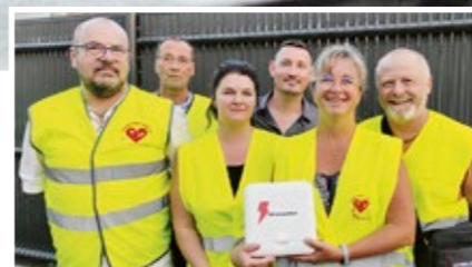
À Liverdun, une deuxième équipe de SVP a été inaugurée en septembre dernier.