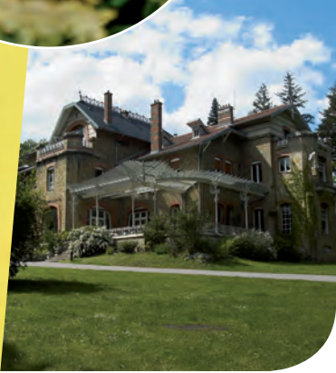
Le Domaine des Eaux Bleues

La présence de nombreuses sources a également fait naître un patrimoine architectural remarquable, notamment à Lay-Saint-Christophe où l'on compte plus de dix fontaines et lavoirs.